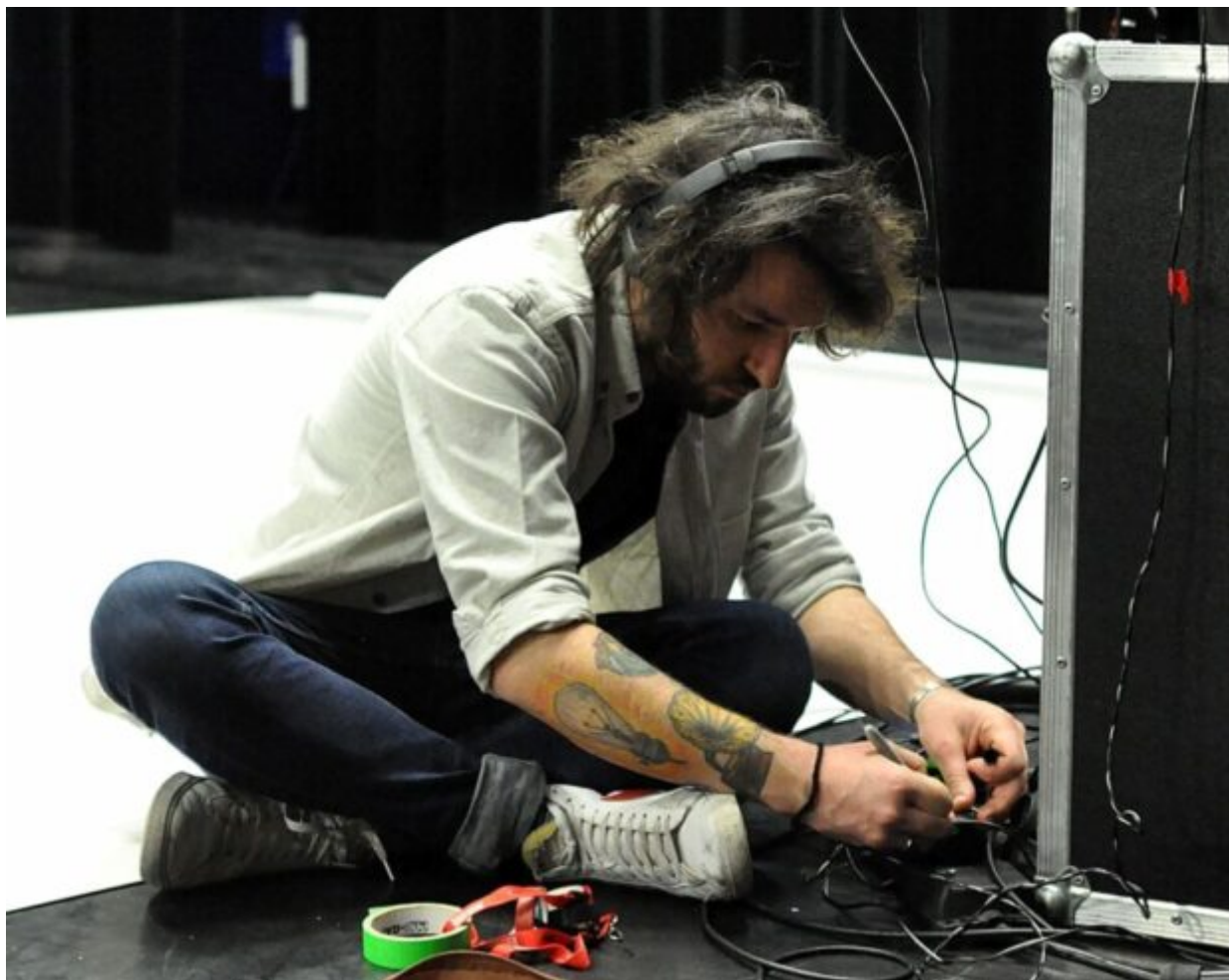
Dernières épissures avant de monter le son